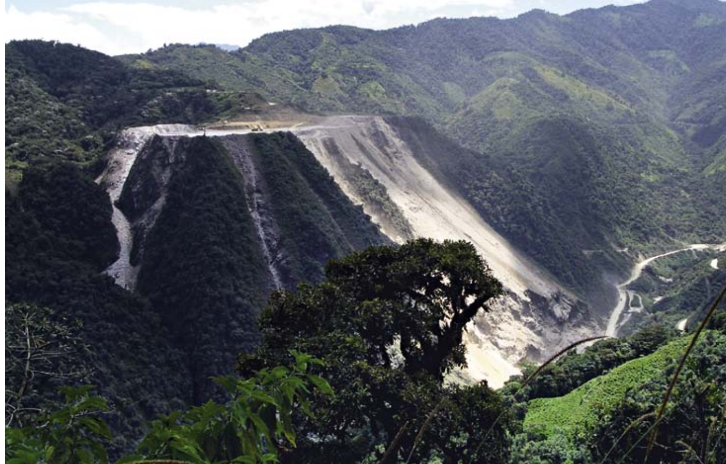
Nahe der Ortschaft Selva Alegre in Ecuador wird Kalkstein abgebaut. Immer mehr Bewohner kämpfen gegen diese Zerstörung ihrer Umwelt