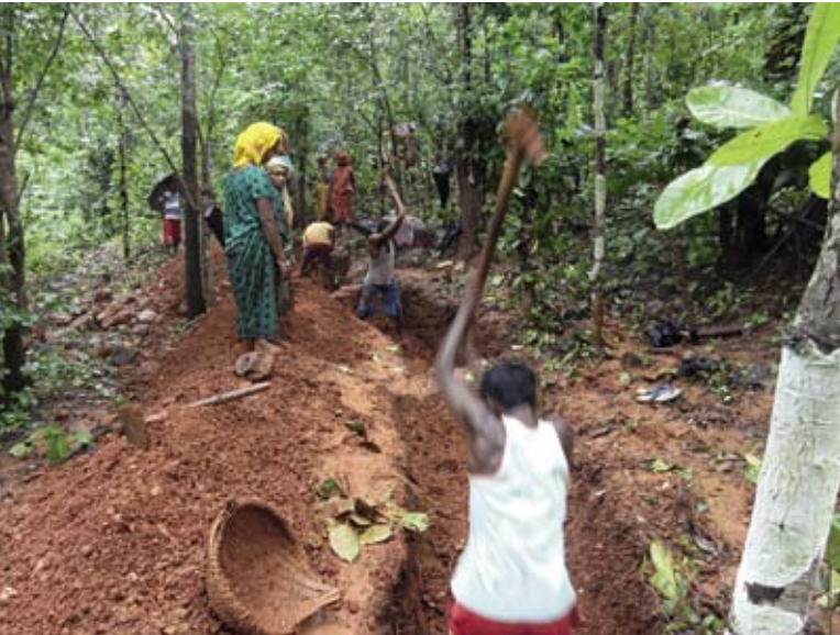
Mit vereinten Kräften legt das Volk der Ho an bewaldeten Hängen Konturgräben an, um den Abfluss des Regenwassers zu reduzieren

Wasserspeicher, Aufforstung und kleine Gärten: Das neue Kooperationsprojekt von »GEO schützt den Regenwald e.V.« und der »Karl Kübel Stiftung« im indischen Bundesstaat Jharkhand macht Fortschritte