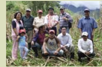
Entlang des Río Irubí wird das Projektteam 20 000 Schattenbäume pflanzen – als Schutz gegen die Wasserverdunstung

die Musterpflanzung den Projektbetreibern als Basis für eine dauerhafte Einkommensverbesserung dienen: durch den Verkauf von Früchten und Fruchtbäumsetzlingen, darunter zum Beispiel Chirimoyas (Rahm-äpfel), diverse Zitrusfrüchte und Avocados.