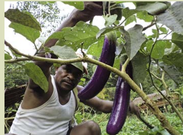
Marktreif: Auberginen auf der Insel Waigeo im Raja-Ampat-Archipel

auf Waigeo gefördert werden. Und durch die Pflanzung kostbarer Adlerholz-Bäume ( gaharu ) soll unter Obhut der Projektbegünstigten Holz heranwachsen, das nach sieben Jahren vermarktet werden kann. Ist die