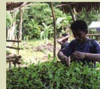
Einheimische der Mayalibit Bay pflegen ihre Anzuchtbeete

Pilotphase erfolgreich, werden die Aktivitäten zeitlich und räumlich ausgeweitet. Erstmals in der Geschichte von „GEO schützt den Regenwald e.V.“ wird ein Vorhaben des Vereins durch eine Stiftung teilfinanziert – die Norddeutsche Stiftung für Umwelt und Entwicklung. Falls auch Sie dieses Projekt gezielt unterstützen möchten, freuen wir uns über Ihre Spende unter dem Stichwort: „West-Papua“.